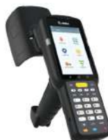
RFID UHF MC3390xR