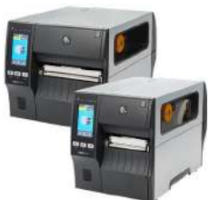
RFID Series ZT411